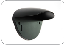
WC_HR50 Tapa de protección para el sensor HR50