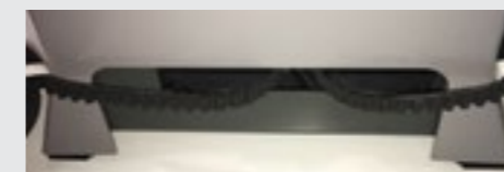
■ Silencioso: Transmisión por correa.

Accionador para puertas correderas de hasta 400 kg