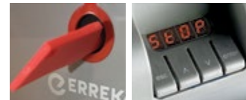
■ Práctico sistema de desbloqueo con llave ■ Programación por display