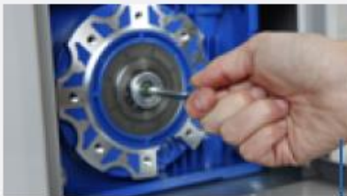
Práctico sistema de desbloqueo con llave personalizada