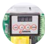
Consola de programación INVERTER