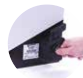
Práctico sistema de desbloqueo con llave personalizada