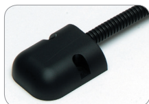
Juego de cableado de SSS-5