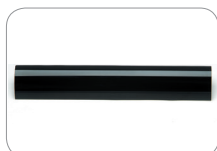
Cubierta del filtro de SSS-5