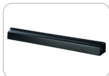
SSS-5 WC Cubierta para intemperie en negro 700 mm de longitud