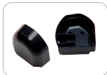
Juego de tapones para los extremos de SSS-5