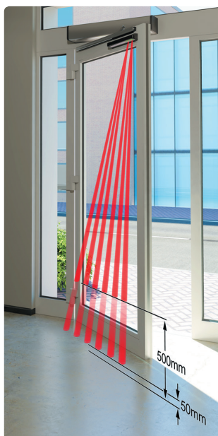
Ajuste de la distancia del área de detección