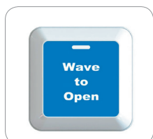
Opción de pegatina 3