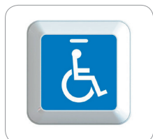
Opción de pegatina 2